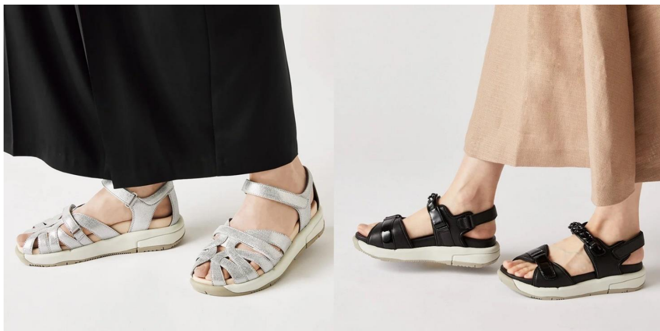
<レザーアジャスタブルサンダル WoW10>

https://www.mhlw.go.jp/www1/topics/kenko21_11/b2.html