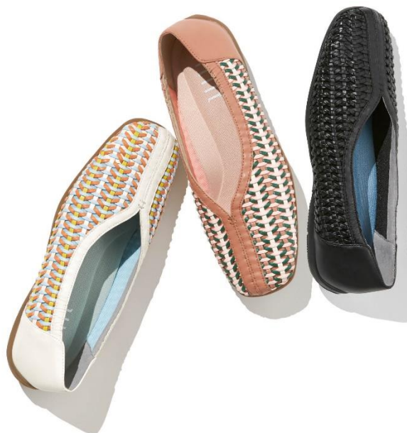
メッシュワイドスクエアフィットフラット（税込価格：11,990円） 【商品URL： https://fitfit.jp/commodity/SFIT0841D/FI5856BW10028/ 】

そこでfitfitでは、おしゃれなデザインと足へのやさしさを両立するため、独自技術のインソールや製法を駆使し、見た目はフラットでありながら歩きやすく快適な履き心地のフラットシューズ「メッシュワイドスクエアフィットフラット」を開発、全国の店舗および通販サイトにて新発売しました。